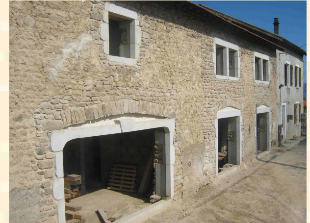
Réhabilitation d'une grange avec création d'ouvertures