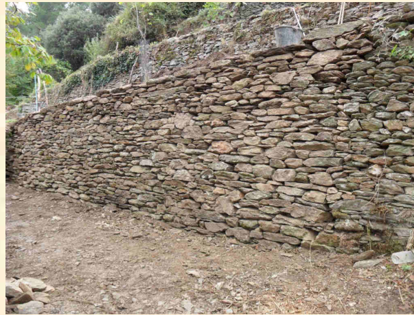
Mur de soutènement terrasse agricole