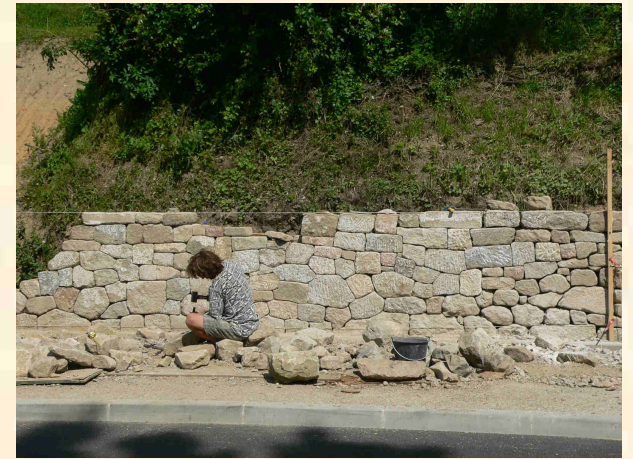
Mur de soutènement d'un talus