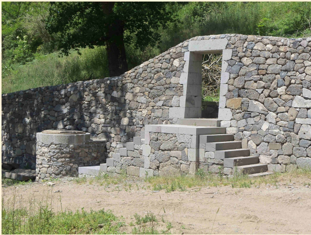
Margelle de puits maçonnée, escalier et mur en pierre sèche