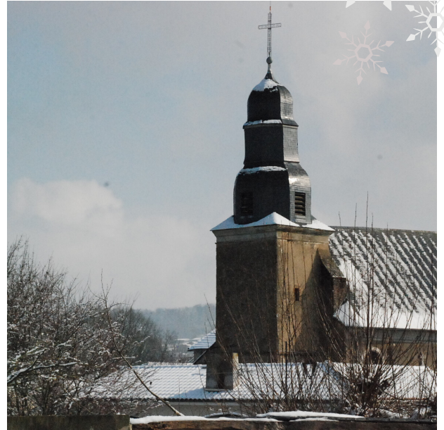
Hôpital Marchant (Haute-Garonne) ©Fondation du patrimoine Eglise de Cabanac (Hautes-Pyrénées) ©Fondation du patrimoine