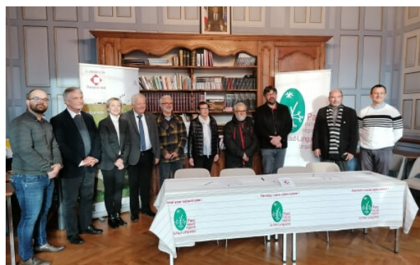
Représentants délégués de la Fondation du patrimoine de l'Herault et du Tarn, Président du PNR et maire de la ville de Brassac

(Voir dossier sur le Pont Vieux et la façade de l'Hôtel de Ville, page 6)