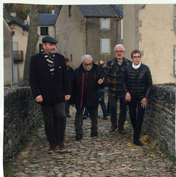
© Fondation du patrimoine Représentant délégué de la Fondation du patrimoine de l'Herault et du Tarn, Président du PNR et maire de la ville de Brassac

L'officialisation du partenariat entre le Parc naturel régional du Haut-Languedoc et la Fondation du Patrimoine s'est déroulée le jeudi 28 novembre 2019 en l'Hôtel de Ville de Brassac, dans le Tarn.